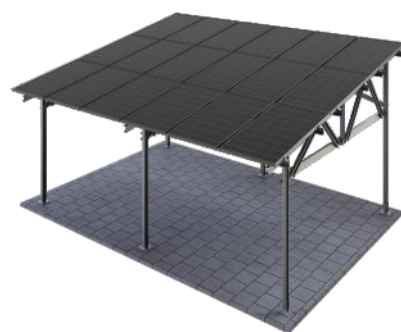
Beschichtet Farbton nach RAL