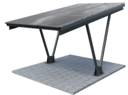
Beschichtet Farbton nach RAL