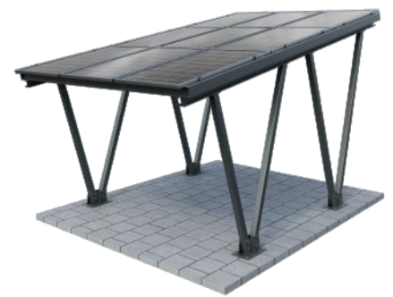
Beschichtet Farbton nach RAL