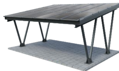
Beschichtet Farbton nach RAL